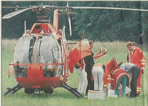
Ein Rettungshubschrauber landete in Waltrop, um den durch Schüsse verletzten Polizisten zu helfen.